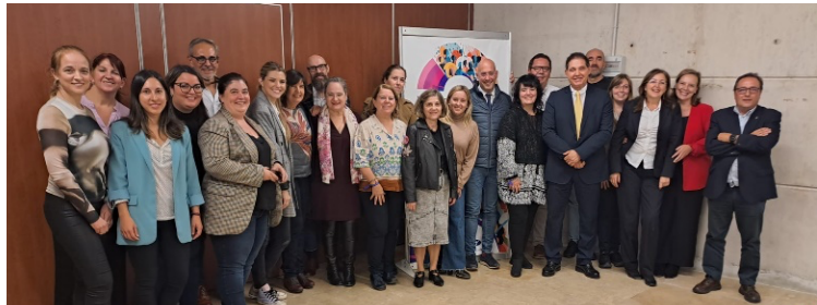
Foto de familia de la Reunión Anual de la División de Psicología Jurídica del Consejo General de la Psicología de España, con los vocales representantes del área de las juntas de gobierno de los colegios autonómicos, Tarragona, noviembre de 2023.

Con ocasión de la VI Convención del Consejo General de la Psicología , el pasado 18 de noviembre en Tarragona, se celebró la reunión de representantes del Área de Psicología Jurídica de los distintos colegios autonómicos. Estas reuniones tienen una periodicidad anual y en ellas se suelen compartir las experiencias de los distintos colegios; se exponen las actividades realizadas durante el último año desde el Consejo que afectan al área; y se realizan propuestas de futuro sobre las necesidades de ese ámbito profesional.